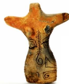
下森鹿島遺跡出土の土偶