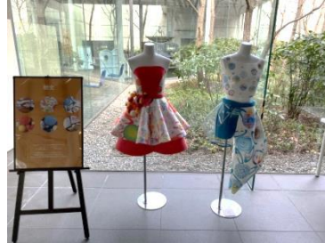
【衣装のテーマ】歴史