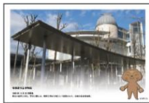
▲相模原市立博物館