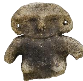
県営三ヶ木団地内遺跡出土の土偶