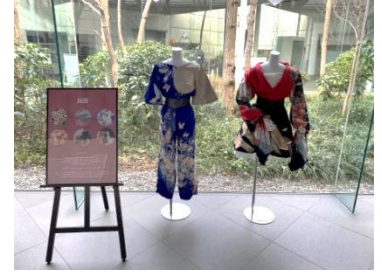
【衣装のテーマ】民俗