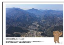
▲青野原上空から見た道志川