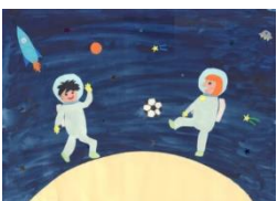
【絵画の部】〈小学生部門〉 最優秀賞