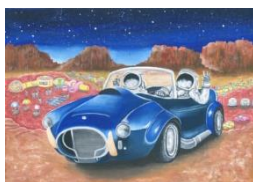
【絵画の部】〈中学生部門〉 最優秀賞