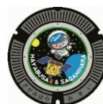
◀さがみん×はやぶさ2 デザイン (博物館前)