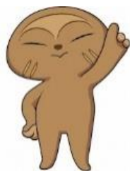
博物館キャラクター おびのっち