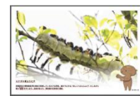
▲エナガの巣立ちビナ