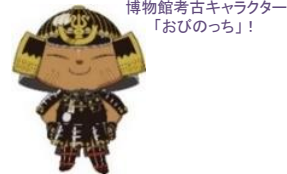
博物館考古キャラクター 「おびのっち」!

中止となった企画展「真・津久井城展」にて展示予定であった「相州 津久井城図」を期間限定で特別公開します。また、津久井城をイメージしやすくなるよう想定イラストも展示しています。